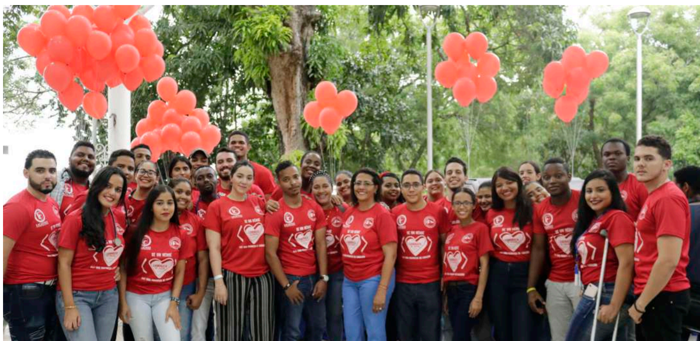
Estudiantes de la Facultad de Ciencias de la Salud que participaron en la jornada